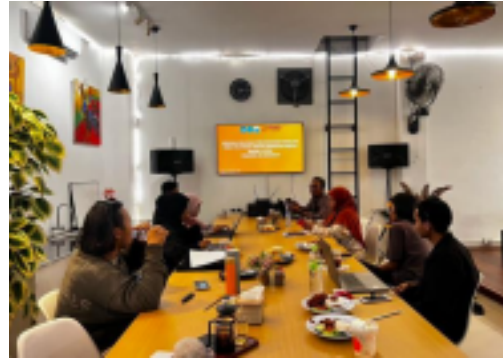
Foto 1. Proses pendampingan dan pelatihan Photo Story Telling Partisipatif Sebagai media advokasi anti perundungan dan Kesehatan mental remaja.