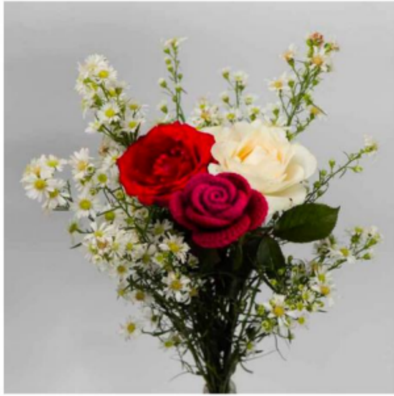
Foto 2. Beberapa contoh hasil karya fotografi partisipan pelatihan.

Tema: Merawat Alam, Memperkuat yang Rentan