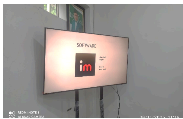
Gambar 3. Pengenalan platform meme

Tema: Merawat Alam, Memperkuat yang Rentan