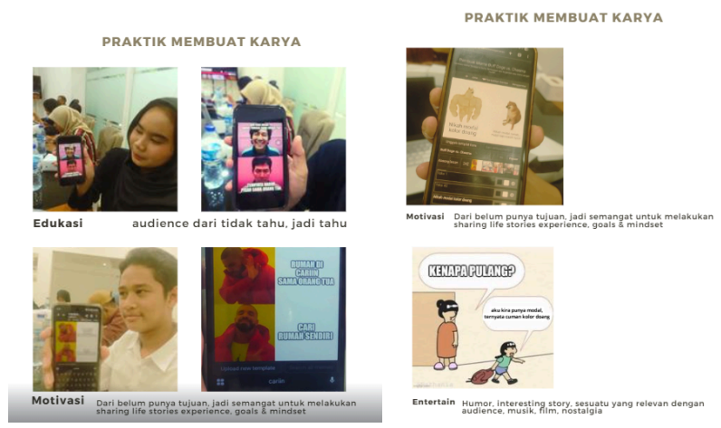
Gambar 6. Konten Meme Peserta

Tema: Merawat Alam, Menguatkan yang Rentan