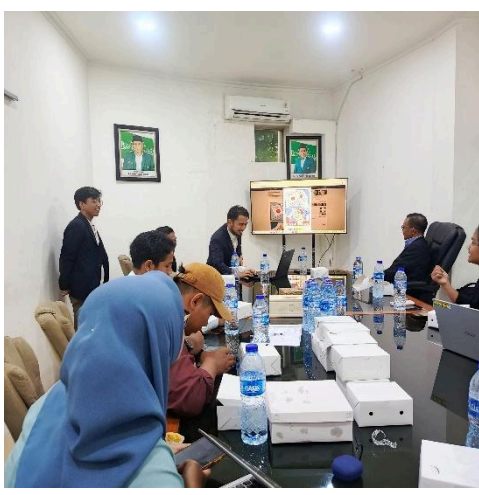
Gambar 4. Pengenalan Imgflip

Pada tahapan kedua, pengenalan platform bernama Imgflip . Tahapan ini merupakan kegiatan tim menjelaskan apa itu Imgflip dan bagaimana cara penggunaannya. Pada tahap ini, tim pelaksana juga memperkenalkan dan menjelaskan fitur-fitur yang ada pada platform meme secara bertahap.