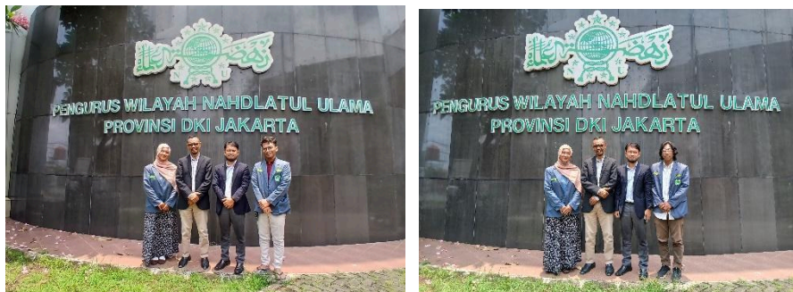
Gambar 1.1: Tim Sowan ke PWNU Nahdhatul Ulama Jakarta Selatan

Berdasarkan temuan di lapangan, tim pelaksana memandang perlu dilakukan pembinaan dengan cara mengadakan pelatihan pengenalan platform meme untuk literasi.