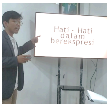
Gambar 7. Tim Pelaksana Mengingatkan Etika Literasi Digital Kepada Peserta IPNU-IPPNU

Tema: Merawat Alam, Menguatkan yang Rentan