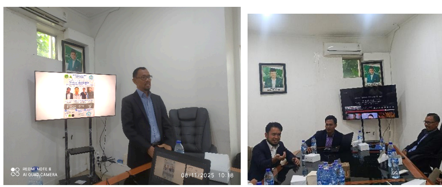
Gambar 1. Pembukaan oleh Tim Pelaksana PKM X IPNU-IPPNU Jaksel

Tema: Merawat Alam, Menguatkan yang Rentan