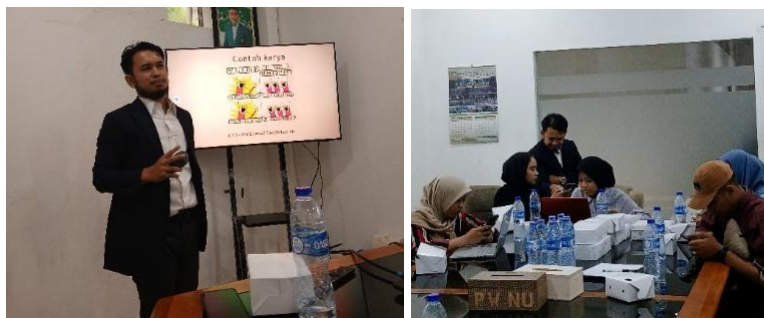
Gambar 5. Praktik platform meme oleh tim dan peserta

Berikut terlampir (lampiran) hasil desain dan konten peserta selama pelaksanaan kegiatan PKM (pengabdian kepada masyarakat), yang dilaksanakan secara tatap muka di PWNU bersama PC IPNU-IPPNU Jaksel, Jakarta, 08 November 2025.