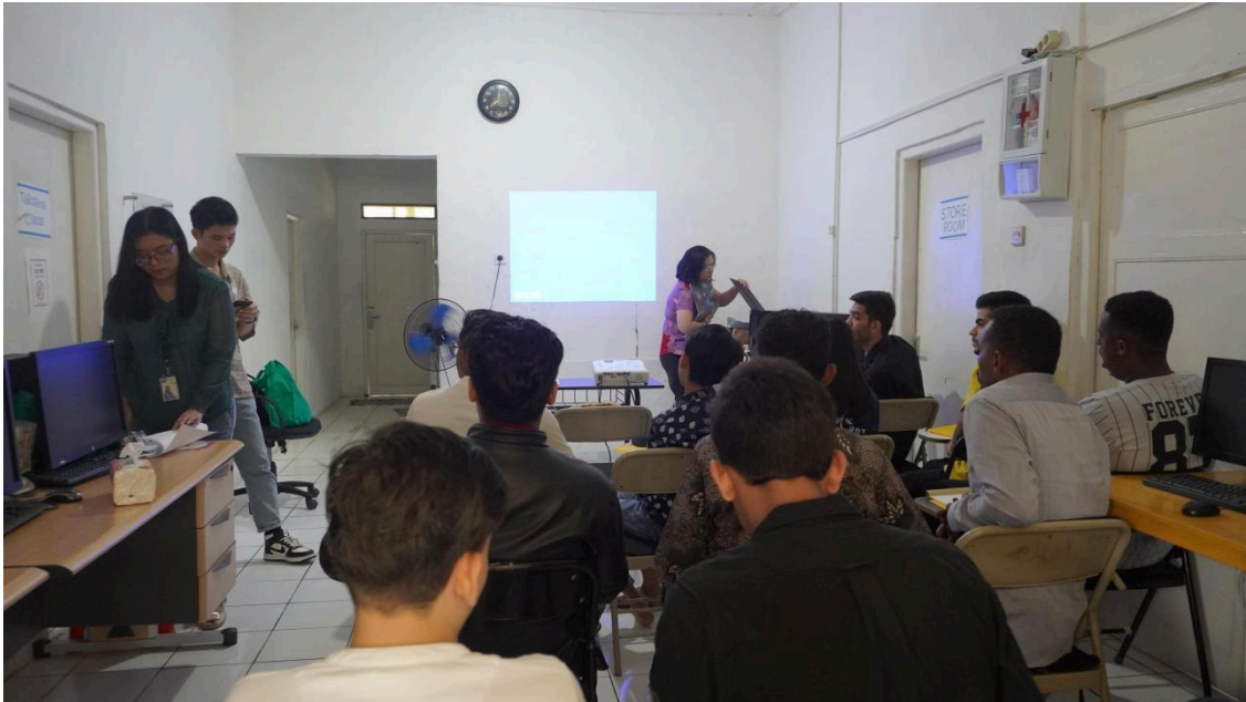
Gambar 3.1 Pelaksanaan pelatihan penulisan kreatif di RTP, Cisarua, Bogor.

Tema: Merawat Alam, Menguatkan yang Rentan