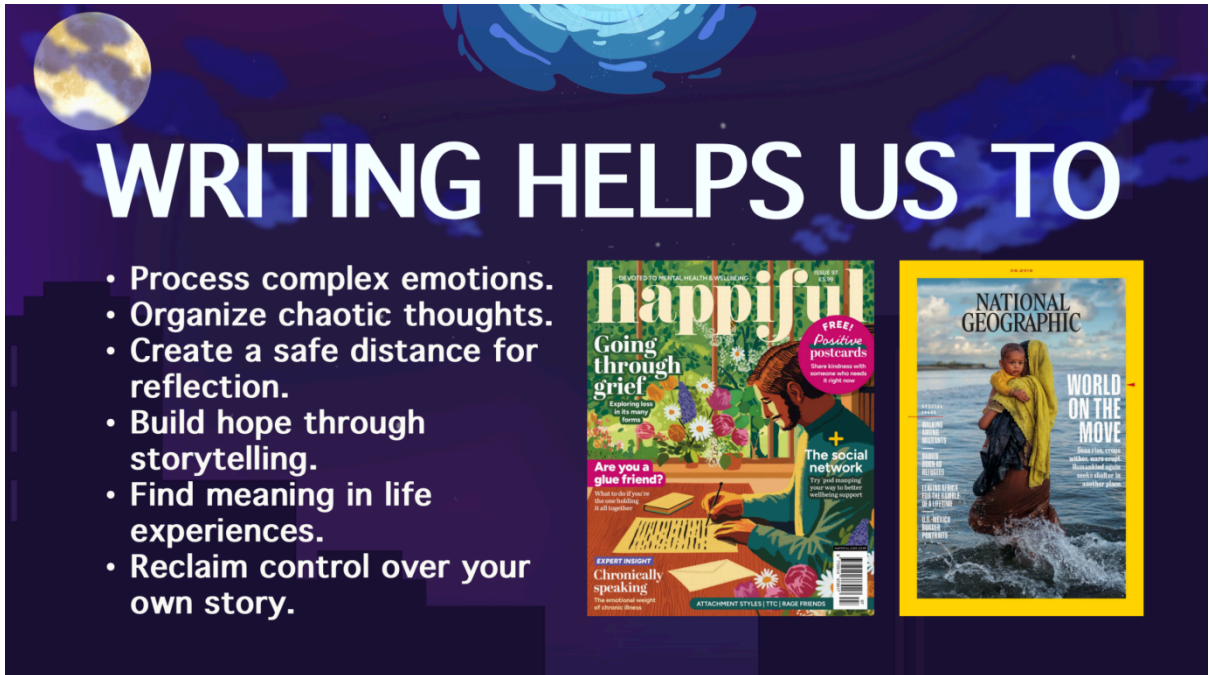
Gambar 3.2 Kutipan materi sesi 1 di RTP, Cisarua, Bogor.

Tema: Merawat Alam, Memperkuat yang Rentan