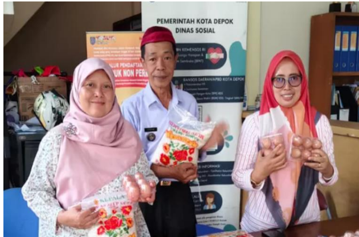
Gambar 1. Aparatur Kelurahan Curug mempersiapkan PMT lokal.

anak yang mengalami stunting dan memberikan edukasi pola asuh dan literasi gizi kepada orang tuanya memiliki kedudukan yang sama pentingnya.