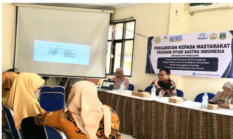
Gambar 5. Penyuluhan secara luring oleh ketua program studi Sastra Indonesia Unpam.