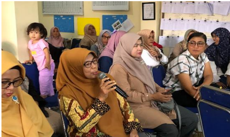
Gambar 6. Diskusi interaktif antara peserta dengan narasumber.