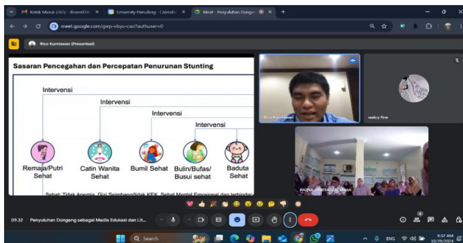
Gambar 4. Penyuluhan secara daring oleh program officer bidang data pemantauan dan evaluasi stunting.