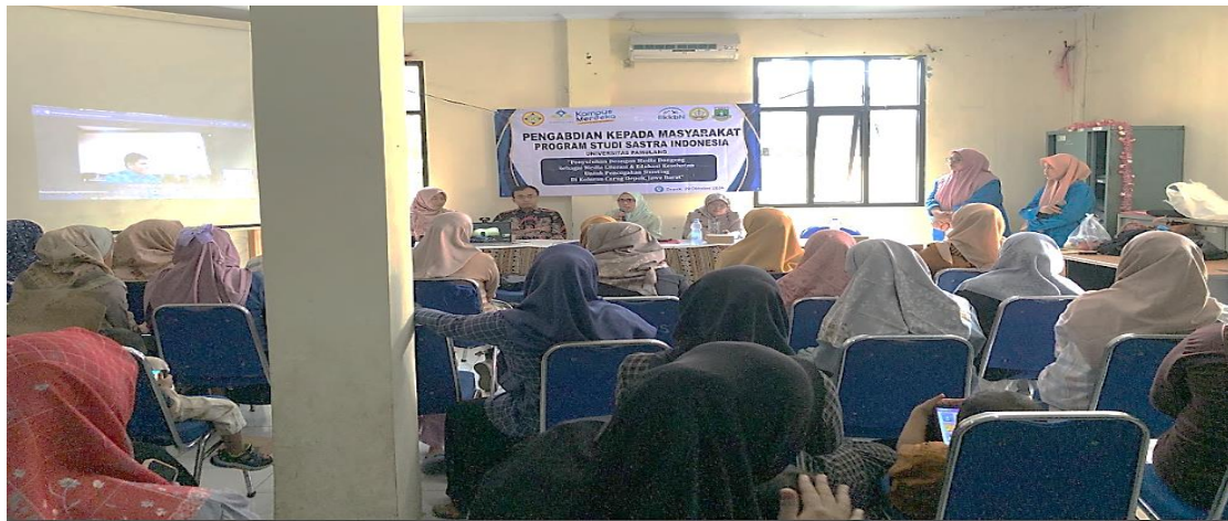
Gambar 3. Situasi Pelaksanaan Kegiatan Penyuluhan.

wilayah Kelurahan Curug dalam upaya menekan angkat prevalensi stunting dan membudayakan dongeng sebagai media literasi dan edukasi kesehatan kepada anak.