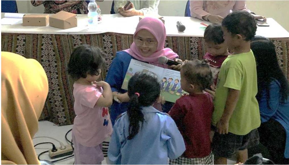
Gambar 7. Kegiatan mendongeng dengan teknik read aloud buku cerita seri kesehatan secara langsung di depan anak-anak balita.

ini ditujukan untuk mengetahui dan mengukur kualitas pelaksanaan PkM yang selanjutnya diharapkan akan dapat ditingkatkan.