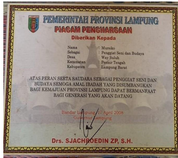
Gambar 6. Penghargaan Mamak Lawok

Sebagai Tokoh Adat, ia merasa sedih jika Hahiwang hilang dan tidak ada yang mau mempelajari. Menurutnya, Hahiwang memiliki sejarah yang sangat panjang. Pada zaman dahulu, orang-orang di Pesisir Barat, melawan penjajah Belanda dengan cara Hahiwang. Mereka meratap atau mengungkapkan kesedihannya melalui Hahiwang. Ungkapan kesedihan ini dipakai karena nenek moyang orang Pesisir Barat mengetahui bahwa Kolonial tidak bisa berbahasa Lampung. Di situlah, ada makna-makna yang diselipkan berupa semangat perjuangan dan perlawanan kepada penjajah.