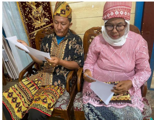
Gambar 11. Para maestro mengulas syair Hahiwang yang ditulis peserta.

Sesi pelatihan inti adalah ketika para peserta dibagi menjadi beberapa kelompok. Peserta dibagi menjadi tiga kelompok yang berisikan empat sampai lima orang. Di dalam kelompok tersebut, peserta diminta untuk membuat lirik syair Hahiwang. Tema yang diberikan bebas sesuai kehidupan sehari-hari peserta. Sebelum membuat lirik tersebut, peserta sudah lebih dulu diberi pembekalan tentang tata cara menulis lirik dan cara menyampaikan Hahiwang oleh para maestro. Pembuatan lirik ini memakan waktu selama 20 menit. Pada akhir sesi, para maestro mengulas dan memilih salah satu syair dari ketiga kelompok untuk ditampilkan oleh maestro. Maestro juga mengajak seluruh peserta untuk ikut berhahiwang berdasarkan syair tersebut.