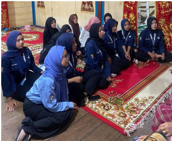
Gambar 10. Para peserta pelatihan menyimak pemaparan materi Hahiwang oleh maestro.

Kegiatan pelatihan Hahiwang diikuti oleh 13 peserta. Kegiatan diawali dengan berbagai sambutan dan bincang santai kepada para peserta. Dalam bincang santati ini didapati bahwa mereka pun menyampaikan baru pertama kali mendapatkan pelatihan mengenai tradisi Hahiwang. Menurut mereka, tradisi ini memang jarang dilakukan di daerah Pesisir Barat. Diskusi santai dilanjutkan dengan pemaparan dan penampilan Hahiwang oleh para maestro. Selain itu, para maestro juga menyampaikan petuah-petuah kepada pemuda Pesisir Barat untuk dapat turut serta dalam upaya pelestarian Hahiwang di Pesisir Barat.