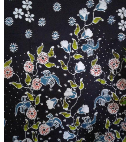
Gambar 2. Motif Batik Gedog di Kerek

Selain batik tulis gedog, lingkungan agraris dan kondisi geografis yang kondusif juga masih mendukung untuk membentuk pola perilaku generasi muda yang arif dan bijaksana. Berbagai kegiatan kemasyarakatan yang masih dijunjung secara turun temurun juga masih ada, misalnya manganan atau sedekah bumi. Walaupun tidak semua kalangan masyarakat berpartisipasi dalam kegiatan budaya tersebut, tetapi berbagai kreativitas masyarakat yang bersumber dari local genius mampu berkontribusi secara positif di Kecamatan Kerek.