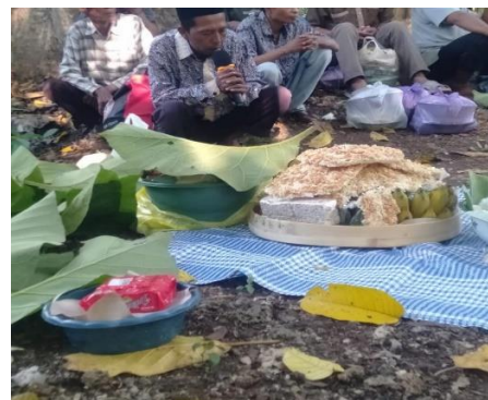
Gambar 3. Manganan atau Sedekah Bumi

Akan tetapi, rasa peduli dan bangga terhadap pelestarian hasil budaya batik gedog terlihat masih kurang. Para generasi muda masih terlihat kurang memahami nilai-nilai yang terkandung dalam batik gedog, sedekah bumi, dan unsur-unsur lain dari local genius . Generasi muda di lingkungan Kecamatan Kerek tidak semua sadar terhadap potensi yang terdapat dalam local genius . Bahkan, mayoritas para pemuda tidak memiliki kemampuan untuk melakukan berbagai tindakan yang mencerminkan nilai-nilai dalam local genius . Hal ini dikhawatirkan akan membuat local genius lambat laun akan hilang.