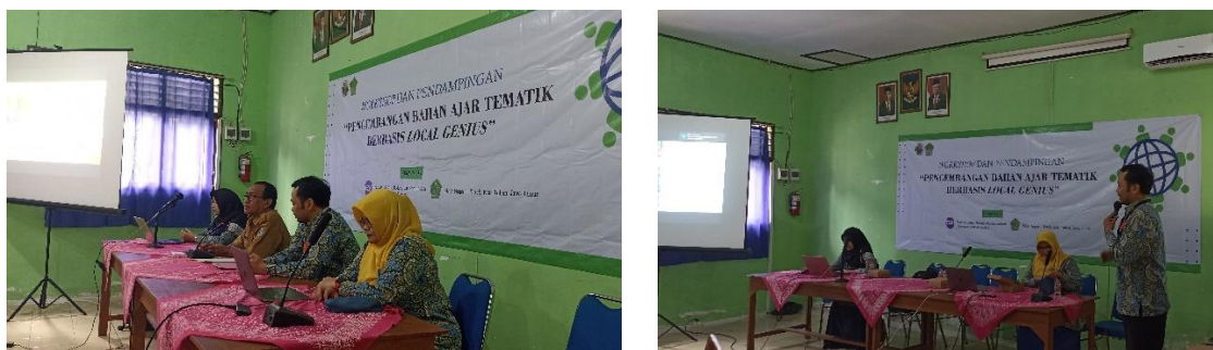
Gambar 4. Pelaksanaan Pengabdian kepada Masyarakat (PkM) di Hari Pertama

Implementasi pertama dan kedua, yaitu (1) memberikan pengantar dalam pengembangan materi ajar khususnya terkait dengan teori pengembangan bahan ajar dan konsep local genius ; dan (2) memberikan pengantar dalam pengembangan materi ajar khususnya terkait dengan sistematika buku ajar tematik berbasis local genius , dilaksanakan pada 10 November 2023.