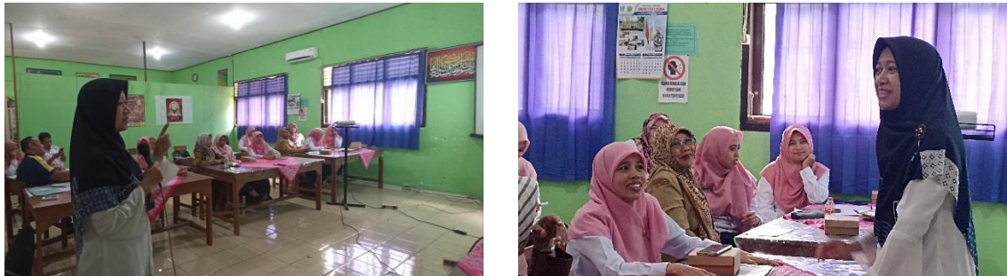
Gambar 4. Pelaksanaan Pengabdian kepada Masyarakat (PkM) di Hari Kedua

Tema: Dinamika Humaniora dalam Lokalitas dan Identitas