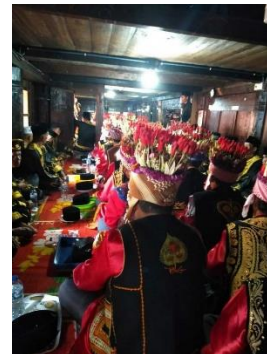
Foto 1 Tampak bagian dalam ruangan luwa Umah Gdang Depati Intan Siulak Mukai Mudik (kiri) dan kegiatan kenduri sko di Umah Gdang Depati Intan Siulak Mukai Mudik (kanan)