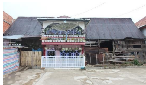
Foto 3 Rumah Larik Laman Ujo Saleman yang dibangun rumah batu di bagian tengah