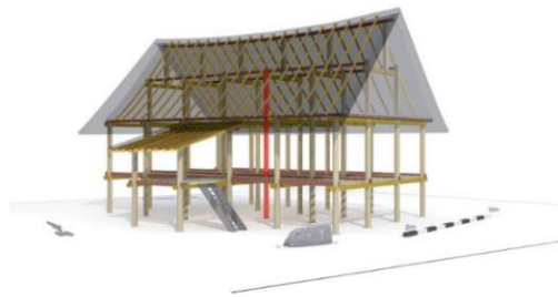
Gambar 1 Rekonstruksi Rumah di Situs Pondok

permukiman kuno di sana dengan temuan batu sendi yang masih memiliki bekas tiang dibuktikan dengan warna lebih terang pada bagian tengah batu (Budisantosa, 2009, hlm. 19).