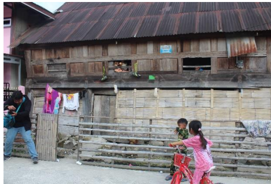
Foto 4 Umah Gdang Larik Panjang Pendung Hiang

Tema: Dinamika Humaniora dalam Lokalitas dan Identitas